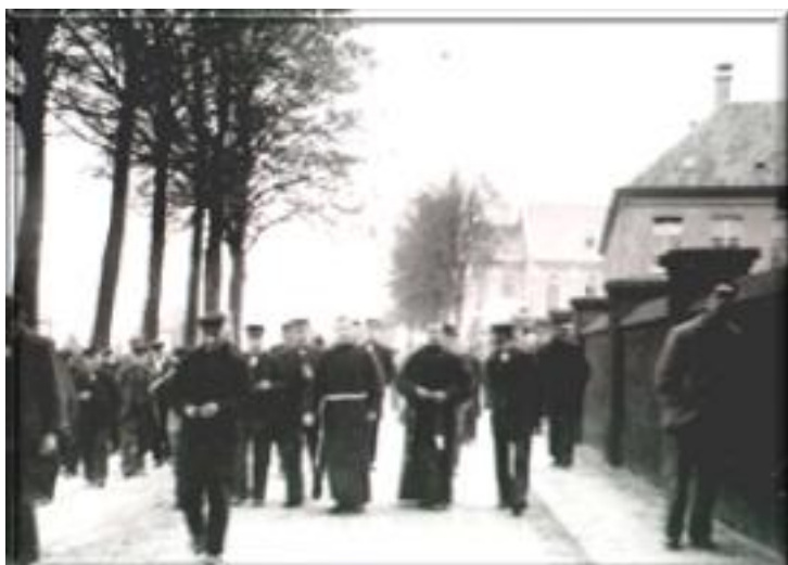
..... Foto uit 1912. De broeders wandelen met de patiënten richting Handel. Aan de rechterkant de oude schansmuur vóór de oude Kluis. Achter de muren twee gebouwen, namelijk het Joseph paviljoen en op de achtergrond de nieuwe kerk. Aan de linkerkant van de weg, nog net zichtbaar, villa "De Hanekamp", toentertijd woonhuis van de geneesheer directeur. .....

Over de ze eerste kluis wordt in 1722 geschreven: "en klein vervallen huysken met een bijliggend hofken Duyds Ordensgrond". In 1734 was het gebouwtje geheel bouwvallig en er is niets van overgebleven.