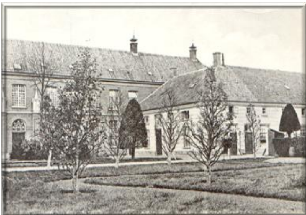
Gezien vanaf het Capucijnen klooster. Links het eerste paviljoen 1836. Alles is gesloopt, op de oude Khuis na