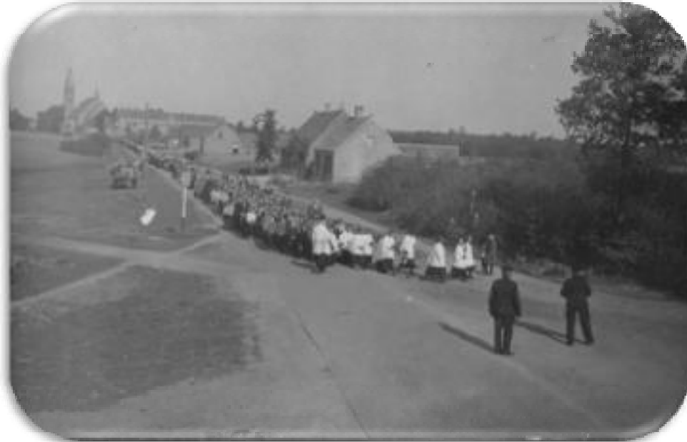
Foto genomen vanaf de splitsing Rutger van Herpenstraat - Donkstraat. Processie voor de vruchten der aarde in de twintiger jaren. Pastoor de Raad laat de stoet keren terug richting kerk. De beide veldwachters regelen het verkeer! Links onderaan ligt een pad dat later de Burgemeester Schafratstraat zou worden. De hele linkerkant van de Rutger van Herpenstraat is onbebouwd tot brouwerij van de Burgt., klooster en kerk.

en Julianastraat", Vanaf 1917 ging er een processie naar Handel. Bij ernstige ziekten ging men ook wel over de "Keskesdijk" bidden. Verder was er de processie naar Haekendover, naar Banneux en de voetprocessie naar Kevelaer.