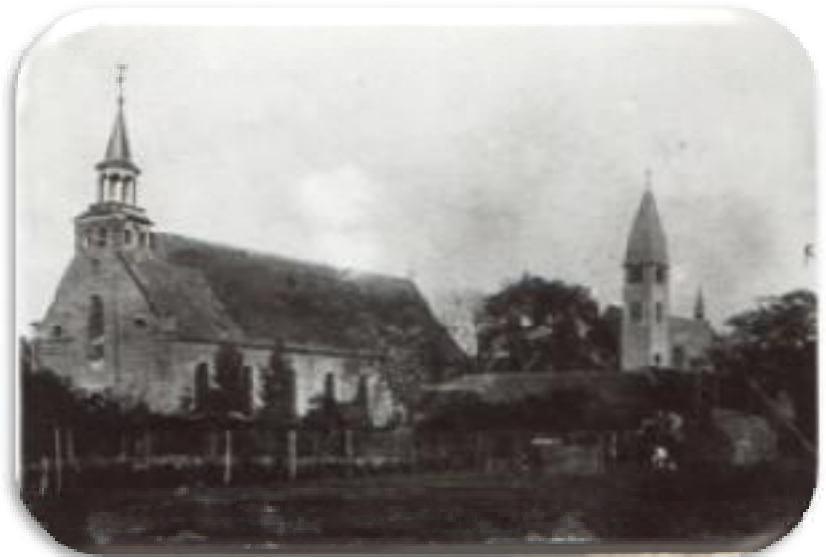
Twee kerken op een foto in 1925.

de boog boven de deur, maar dat kan niet. Het zal wel eeuwig een vraag blijven hoe hij aan zijn korte beentjes komt.