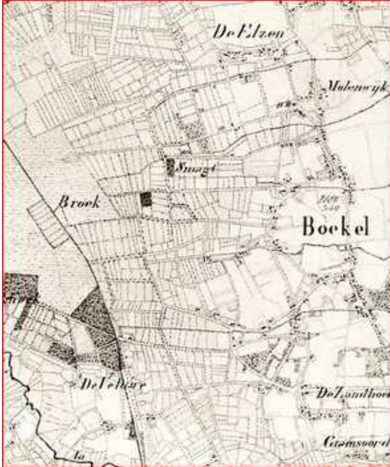
Gedeelte van een topografische kaart uit 1837. Volgens deze kaart is er dan maar 1 windmolen in Boekel en wel op Den Elzen.